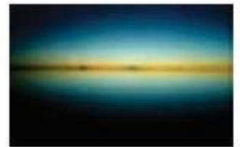
Noa Bellerstein, Sun, 73x120cm, 2004