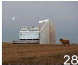
28 נירית גור קרבי Nirit Gur Karby