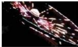
Noa Bellerstein, Untitled 3, 46x82cm, 2011