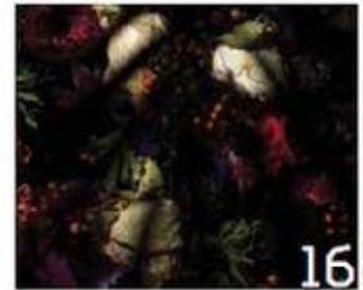
16 הילית כדורי Hilit Kadouri