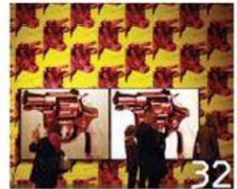
32 נועה בלרשטיין Noa Bellerstein