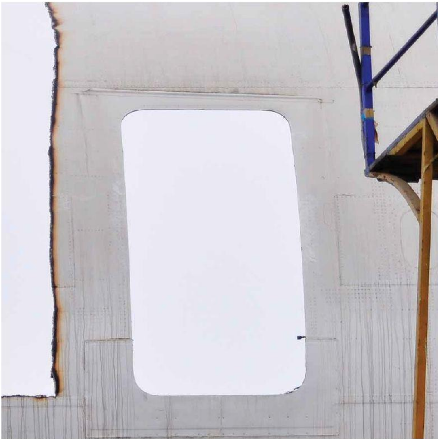
ניר ארצי, מדרגות, הדפסת פיגמנט ארכיווית, 2011 Nir Artz | Escaleras, Archival Pigment Print, 2011