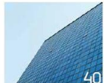
40 תום בוקשטיין Tome Bookshtein