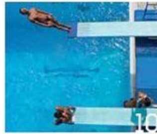
10 אסף קליגר Asaf Kliger