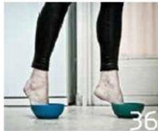
36 ענר גלם Aner Gelem