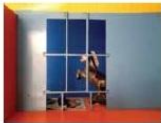
Nir Artzi, Horse Exchange, 50x70cm, 2012