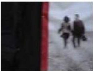
Nir Artzi, After Beuys, 50x70cm, 2008