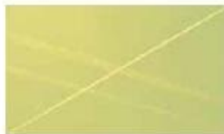
Nir Artzi, Ephemeral Lines, 66X113 9cm, 2012