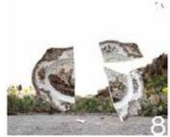
8 אלון כהן רז Alon Cohen Raz