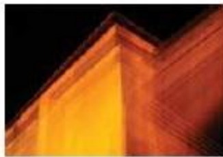
Nir Artzi, Home Lines, 50x77cm, 2009