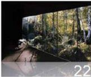
22 לירון זנדמן Liron Sandman