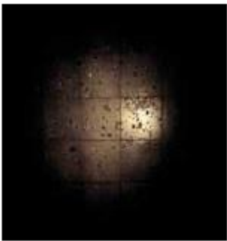
Noa Bellerstein, Glasses, 90x90cm, 2010