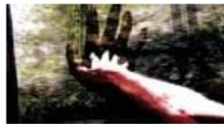
Noa Bellerstein, Untitled 1, 46x90cm, 2010