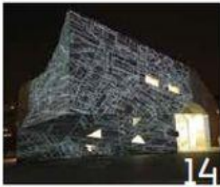
14 גיא יצחקי Guy Yitzhaki